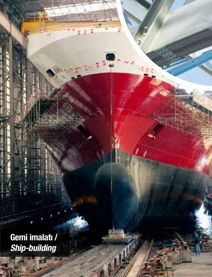
Gemi imalatı / Ship-building