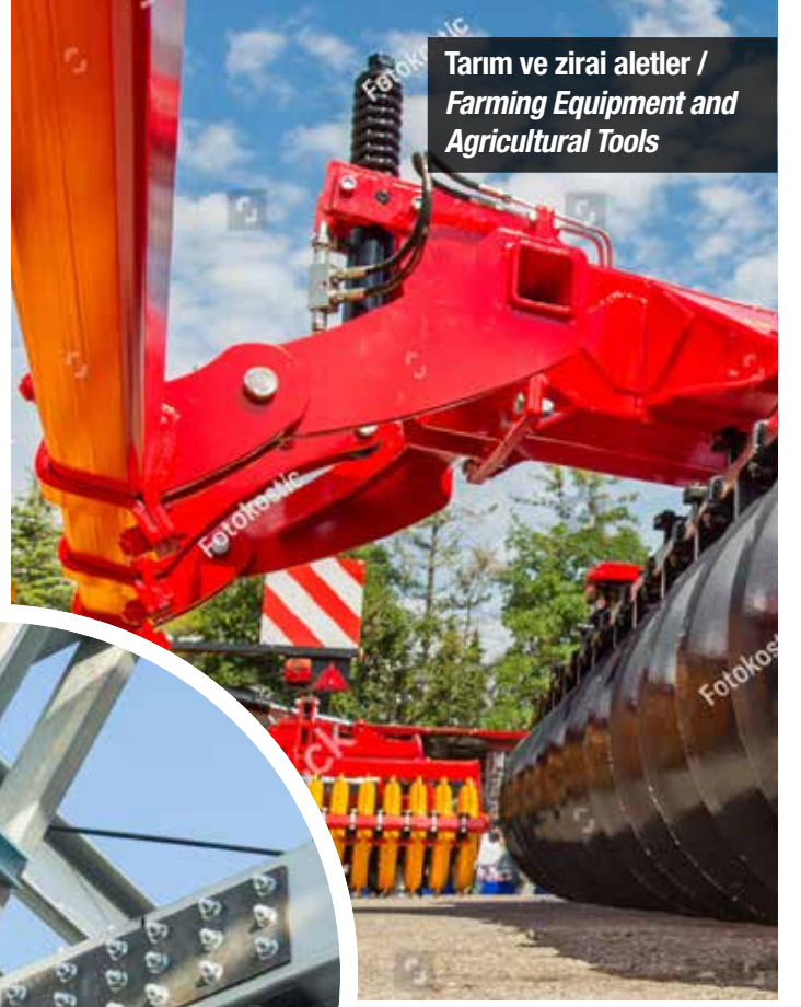
Tarım ve zirai aletler / Farming Equipment and Agricultural Tools