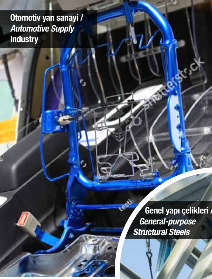
Otomotiv yan sanayi / Automotive Supply Industry