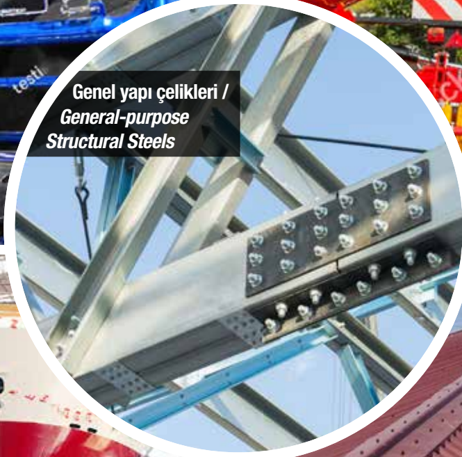
Genel yapı çelikleri / General-purpose Structural Steels